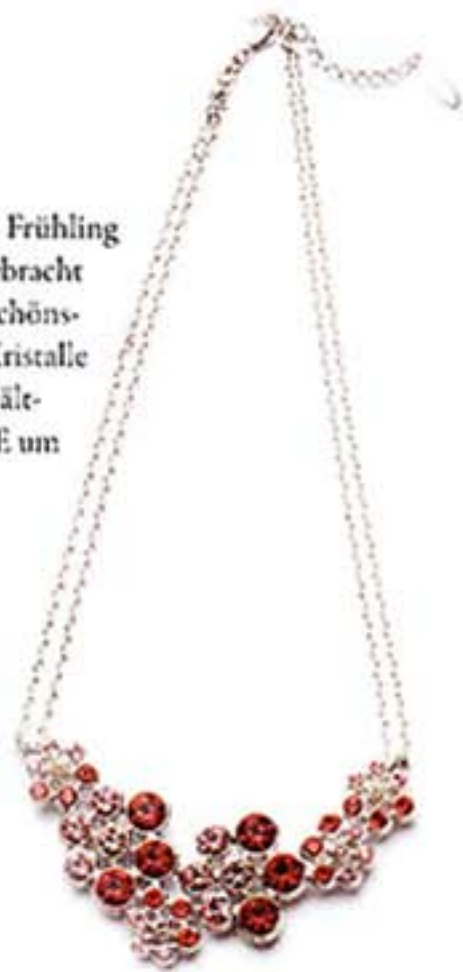
Lux:us hat den Frühling auf den Hals gebracht und dafür die schönsten Swarovski-Kristalle verwendet. Erhältlich bei GALLE um 149,90 Euro.