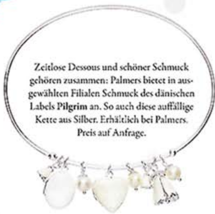
Zeitlose Dessous und schöner Schmuck gehören zusammen: Palmers bietet in ausgewählten Filialen Schmuck des dänischen Labels Pilgrim an. So auch diese auffällige Kette aus Silber. Erhältlich bei Palmers. Preis auf Anfrage.