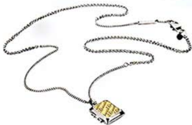
Für Menschen die hoch und höher hinauswollen bietet Diesel eine erstklassige, ausgefallene Kette mit einem Anhänger, in dem Sie das Foto Ihres Liebsten immer mithaben können. Erhältlich bei Diesel. Preis auf Anfrage.