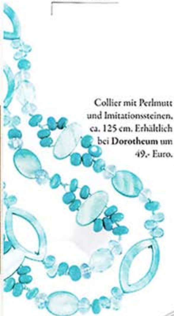
Collier mit Perlmutt und Imitationssteinen, ca. 125 cm. Erhältlich bei Dorotheum um 49,- Euro.