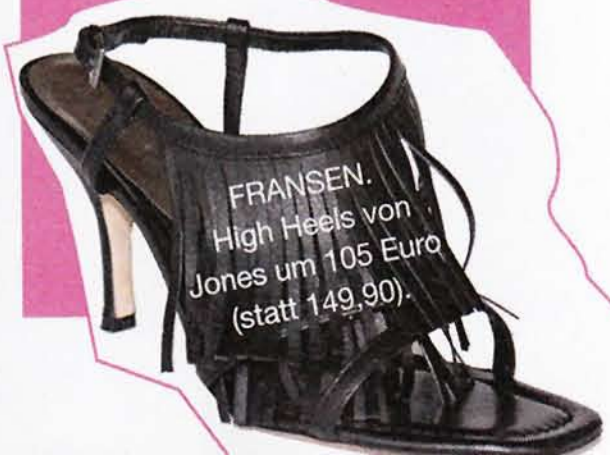
FRANSEN. High Heels von Jones um 105 Euro (statt 149,90).

SALAMANDER: Top-Schuhe von minus 20 bis minus 50 Prozent. www.salamander.at