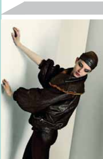
Kollektion: Susan Strasser