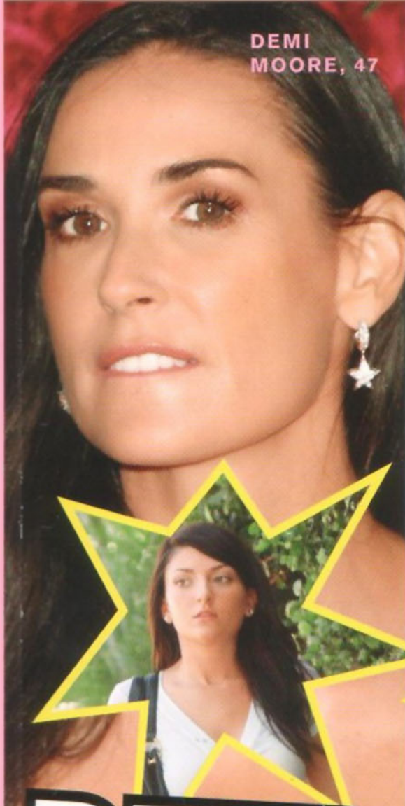
DEMI MOORE, 47

LADY GAGA WIRD IHRE HOCHZEIT EIN SKANDAL?