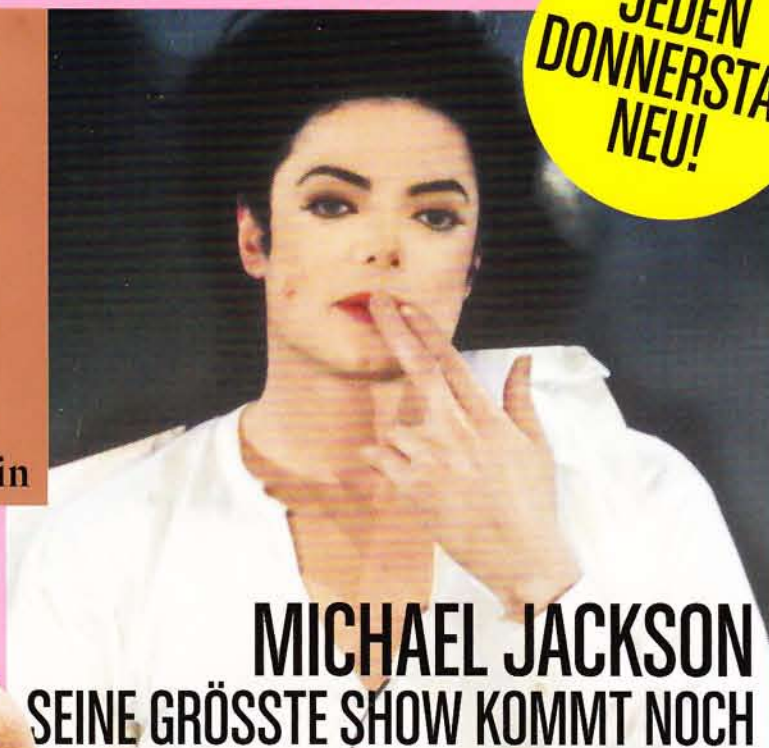
MICHAEL JACKSON SEINE GRÖSSTE SHOW KOMMT NOCH