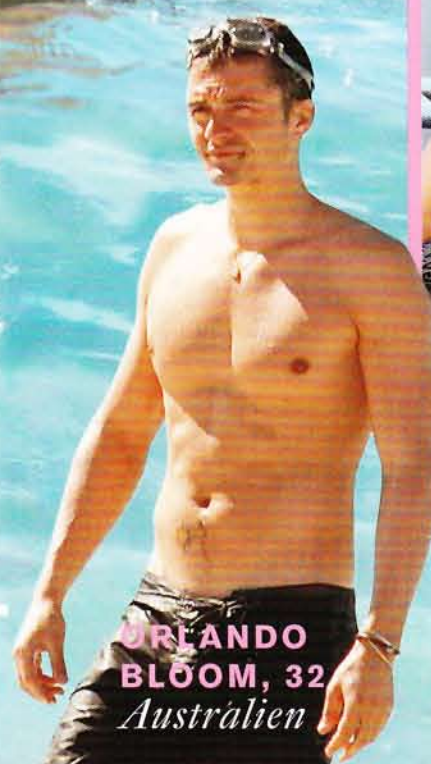
ORLANDO BLOOM, 32 Australien