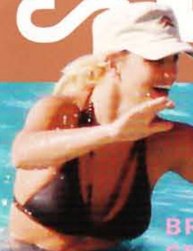
BRITNEY SPEARS, 27 Bahamas

URLAUB MIT DEN STARS: WER SCHON IN DER SONNE LIEGT