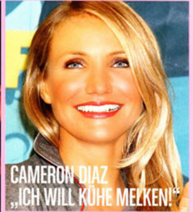
CAMERON DIAZ „ICH WILL KÜHE MELKEN!“