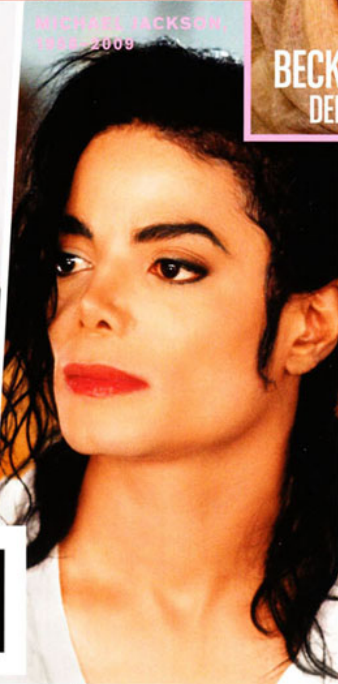
MICHAEL JACKSON, 1958-2009